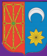
Atarrabiako Udala Ayuntamiento de Villava

Aukeratzera beharturik ez egoteko, eta erabakitzeko gure eskubidea defendatzeko borrokan jarraituko dugu.