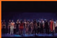
Barañaingo Alaitz Institutua / Instituto Alaitz de Barañain