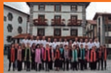
Jeiki-Abesbatza. Leitza / Jeiki-Abesbatza de Leiza