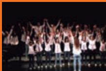
Noaingo Musika Eskola / Escuela Música de Noain