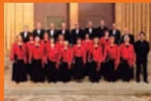
Azkoiengo Udal Eskola / Escuela Municipal de Peralta