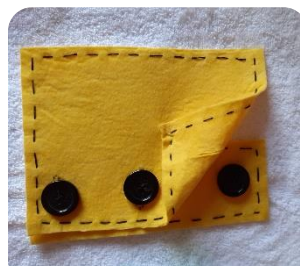
ATAR Y DESATAR BOTONES