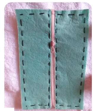
SUBIR Y BAJAR CREMALLERA