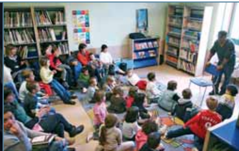
Semana de animación a la lectura. Además de cuentacuentos, en la imagen, la semana de 21 al 25 de abril los niños y niñas disfrutaron de una amplia oferta de actividades relacionadas con la lectura.