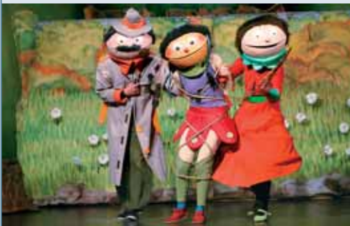
Teatro infantil en la semana de Pascua. Kukubiltxo representó "Kukubeltxo" el día 15 en euskera y el 16 en castellano.