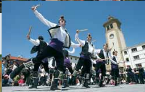
Mercado medieval. El domingo 3 de mayo se celebró el Mercado medieval, que como en ediciones anteriores movilizó a multitud de vecinos y vecinas. Participaron más de cuarenta artesanos y actuó el cuadro de danzantes de Ochagavía.