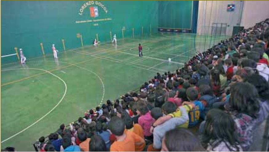
FESTIVAL DE PROMOCION DE REMONTE EN EL LORENZO GOICOA. Organizado por la Fundación Remonte, de la que el ayuntamiento es miembro, el festival tuvo de público a más de 500 escolares.